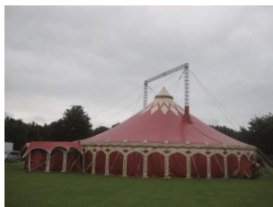
Projektbezogene Unterstützung, z.B. Buskosten