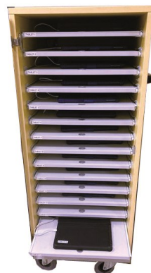
Zuschuss zum Klassensatz iPads