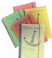
Kostenloses „Ankerheft“ für jedes Kind