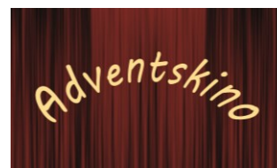
Kino in der Schule