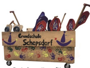
Spielgeräte für Pausen & Sport